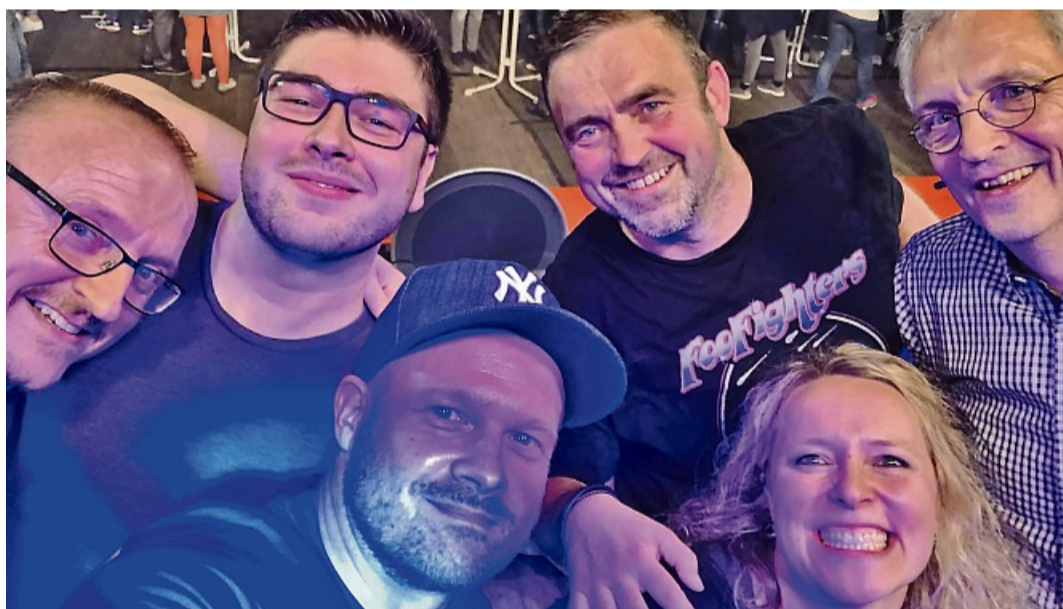
Vor dem Michael Jackson-Show wird die Vor-Band „Offside“ wieder für Stimmung im Festzelt sorgen.