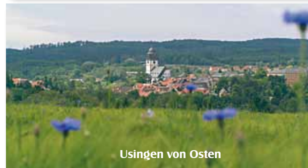
Usingen von Osten