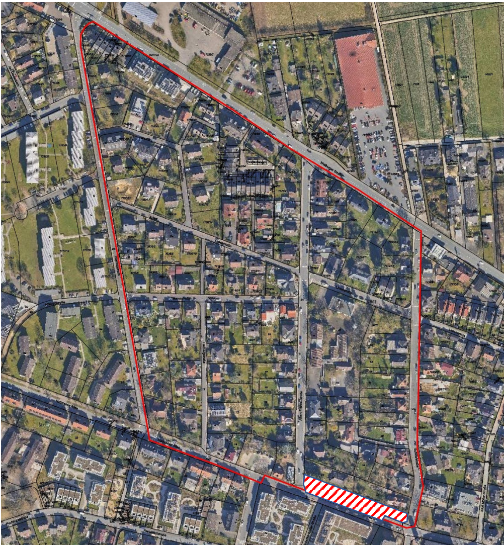
Abb. 1: Geltungsbereich, maßstabslos, Kartengrundlage Überfliegung Stadt Usingen Schraffierte Fläche: Überlagerungsbereich des B-Plans „Hattsteiner Allee/Fritz-Born-Straße“

Der aufzuhebende Geltungsbereich hat eine Größe von ca. 11,42 ha.