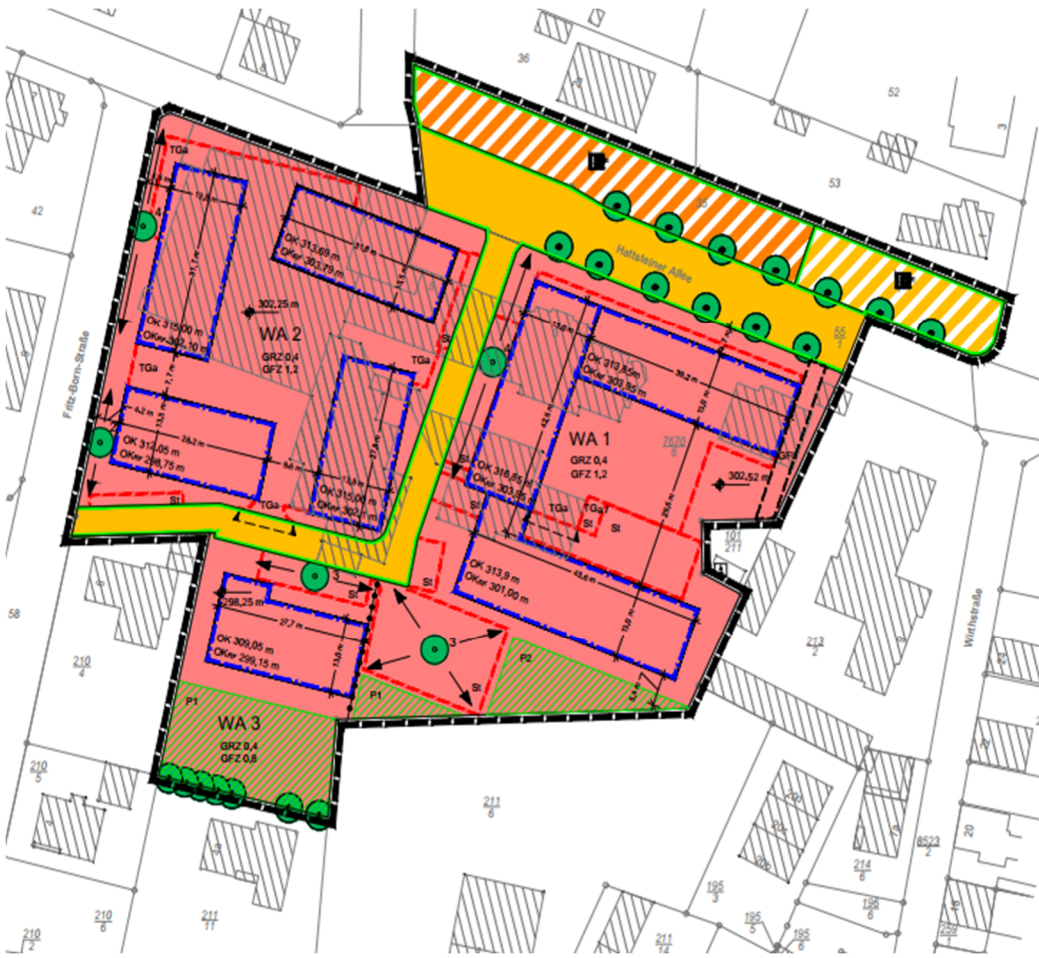
Abb. 3: Vorhabenbezogener Bebauungsplan „Hattsteiner Allee/Fritz-Born-Straße“, nur Planzeichnung

Südlich grenzt der Vorhabenbezogene Bebauungsplan „Hattsteiner Allee/Fritz-Born-Straße“ aus dem Jahr 2021 an das Plangebiet an. In einem kleinen Teilbereich nördlich der Hattsteiner Allee überlagert dieser Bebauungsplan den Bebauungsplan „Albert-Franke Straße“.